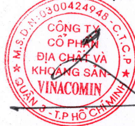
Phạm Tuấn Ngọc